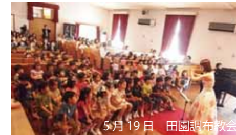
5月19日 田園調布教会