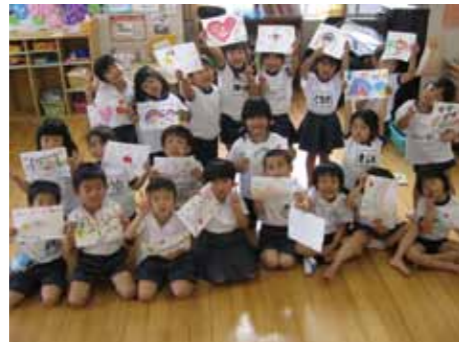
自作の絵とメッセージを示す、牛津幼稚園(熊本県)の年長児たち