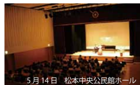
5月14日 松本中央公民館ホール