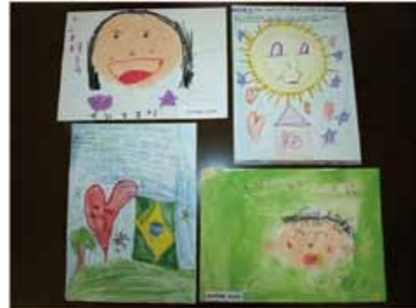
世界中から届いた絵とメッセージ

い、これをクッキーと共に届けるプロジェクトを長期的に行います。現在千通以上のメッセージが届き、被災地へ届ける準備をしています。この働きを通して、被災地の子どもたちと、その他の地域の世界の子どもたちとの心の交流が生まれればと思っています。